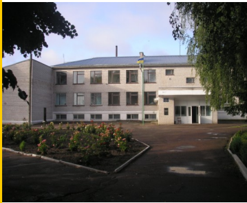
Щиглівська загальноосвітня школа I-III ступенів